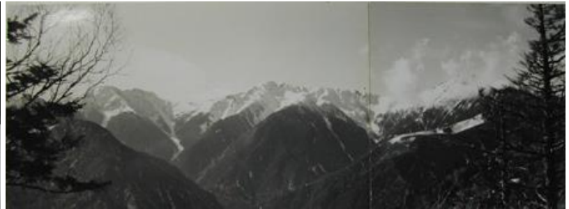
(左) ベト雪と格闘 (上) 晴れた!白根三山だ!!