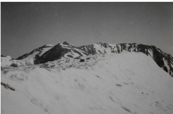
< 桧尾岳から宝剣岳と駒本峯 >

雪の中の桧尾岳 16 時 20 分。桧が鬱蒼と茂るところから「桧王」という古名もあるそうだ。