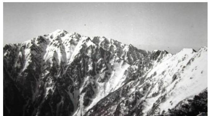
< 桧尾岳から空木岳 (左) 南駒ヶ岳 (中央奥) >

避難小屋に入ることを予定していたが、雪の中に埋まってしまっても見つからない。しかたがないので、桧尾尾根をマセナギ付近まで下り、樹林の中にツェルト設営。時刻は 17 時 30 分。北に宝剣、伊那前岳、千畳敷らが、南に一段と雪の多い空木、池山、木曾殿越、南駒ヶ岳らが、素晴らしい展望のテントサイトだ。